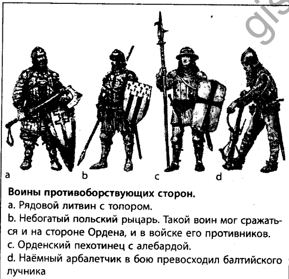
Воины противоборствующих сторон.

— Войну можно разделить на два этапа. Первый этап — август 1409 г. — октябрь 1409 г., второй — июнь 1410 г. — 1411 г. Первый этап войны закончился для поляков неудачно: они потеряли часть своих земель и заключили перемирие с крестоносцами. Мирную передышку обе стороны использовали для подготовки к новому столкновению: собирали войска, готовили оружие и провиант. В декабре 1409 г. Ягайло и Витовт разработали новый план войны. Военные действия возобновились в июне 1410 г. Решающая битва состоялась 15 июля 1410 г. у деревень Грюнвальд и Танненберг.